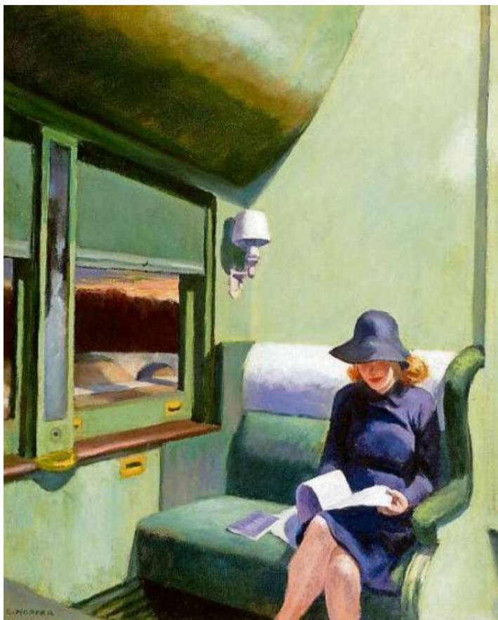
L'enconuscent maletg «Compartment C, Car 293» ha l'artist american Edward Hopper creà dal 1938.

Jau n'hai nagina idea, quant ditg che jau ses gia qua. Durant viagiar na valan betg las medemas leshas da temp sco uschiglio. Visavi da mai sesa ina dama, la suletta outra passagiera dal tren. Ella ha sbassà ses chau, sia fatscha n'è betg visibla pervia da la chapella. Profundada en in cudesch sfeglia ella las paginas, mo paucas èn anc d'anzanz. Jau ser ils eglis e giaschel en la pultruna pulstrada.